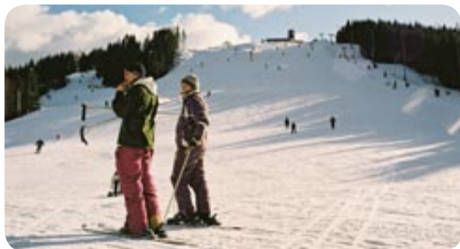
VINTERPARADISSET ISABERG – MED 8 NEDFARTER FÖR BÅDE NYBÖRJARE OCH AVANCERADE ÅKARE.

Vi vill utveckla turistsatsningar som bygger på områdets förutsättningar, men göra det med varsamhet, omsorg och i samråd med markägarna. Detta görs i nätverksform genom att stimulera företag, organisationer, myndigheter och enskilda till initiativ som har betydelse för turismen. I kommunens långsiktiga vision framhålls att upplevelseindustri och serviceverksamheter bör öka i omfattning och att turismen ska ses som en näringsgren bland andra och utvecklas och därmed medverka till att kommunens näringsliv breddas.