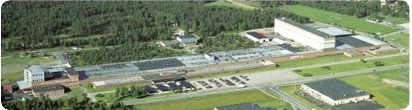
WELAND INDUSTRI CENTRUM I GISLAVED