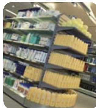
HESTRA INREDNINGAR ÄR ETT FAMILJEFÖRETAG SOM ETABLERADES REDAN ÅR 1900 OCH UTVECKLAR SAMT TILLVERKAR IDAG BUTIKSINREDNINGAR TILL STORA DELAR AV NORRA EUROPA.