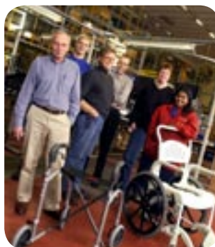
ETAC AB UTVECKLAR, TILLVERKAR OCH MARKNADSFÖR PRISBELÖNTA HJÄLPMEDEL FÖR MÄNNISKOR MED NEDSATT RÖRELSEFÖRMÅGA.