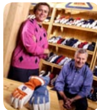
HESTRA-HANDSKEN SOM GRUNDAS 1936 TILLVERKAR HANDSKAR FÖR HELA VÄRLDEN, MED HÖG KVALITET FÖR AKTIV FRITID OCH ARBETE.