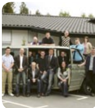
KEY IT-PARTNER I HESTRA ARBE-TAR MED MODERN INFORMATIONSTEKNIK, WEBB- OCH LOGISTIKLÖSNINGAR. I IT-BRANSCHEN SEDAN 1979.

Design är ett viktigt konkurrensmedel på en allt tuffare marknad där det inte längre bara gäller att producera billigt och med kvalitet, utan där produkten också måste ha ett mervärde i form av god design. Att använda form och design innebär att ett företags varumärke kan stärkas. Företag från trakten som arbetar mycket med form och design är bland annat Albert Samuelsson & Co (Skeppshultscykeln), ESBE (ventiler och ställdon), Dolomite och Etac (handikapphjälpmedel), Träspecialen, Hestra inredningar och Isaberg Rapid (häftprodukter).