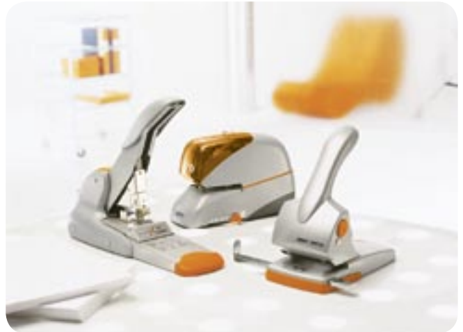
ISABERG RAPID ÄR VÄRLDSLEDANDE INOM KONTORSHÄFTARE, HÄFTPRODUKTER, KLAMMER OCH HÅLSLAG - MYCKET TACK VARE EN FRAMSYNT DESIGNSTRATEGI OCH PRODUKTUTVECKLING.