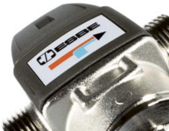
ESBE AB TILLVERKAR, UTVECKLAR OCH MARKNADSFÖR VENTILER OCH STÄLLDON FÖR REGLERING AV VÄTSKEBURNA SYSTEM I SMÅ OCH STORA FASTIGHETER.

De flesta som arbetar inom industrin i Gislaveds kommun är knutna till verkstads- och metallindustrin. Skeppshult i söder är ett exempel på en ort med en stark inriktning mot metallindustri. I Reftete ligger ESBE, ett marknadsledande företag inom sin nisch och vars produktprogram utgörs av ventiler och ställdon.